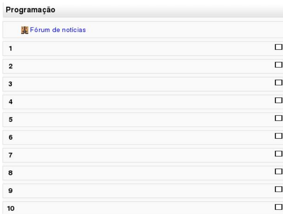
Figura 5: Curso no formato Tópicos

A Figura 3.5 mostra o mesmo curso configurado no formato Tópicos . Como no caso do curso semanal, o professor estabelece o número de tópicos e decide quais tópicos ocultar ou não.