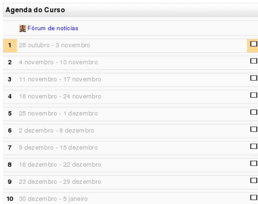
Figura 4: Curso no formato Semanal

A Figura 3.4 mostra a coluna central do curso usado como exemplo no formato Semanal . O professor estabelece (em Configurações do bloco Administração ) a data de início e o número de semanas.