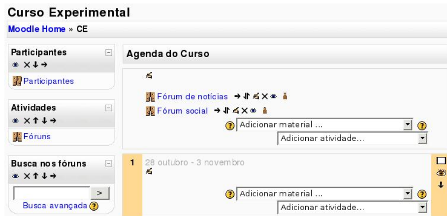
Figura 7: Modo Ativar edição

Clicando em Ativar edição (veja Figura 3.1) o professor verá a tela mostrada na Figura 3.7 (o curso usado como exemplo está no formato semanal).